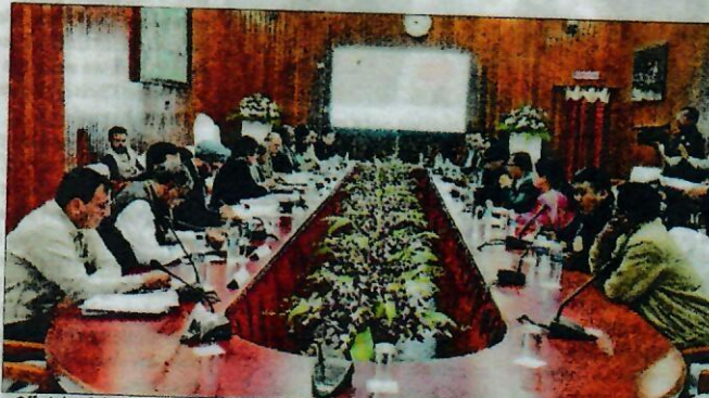
Officials of the 15th Finance Commission meeting state stakeholders at Old Secretariat Block