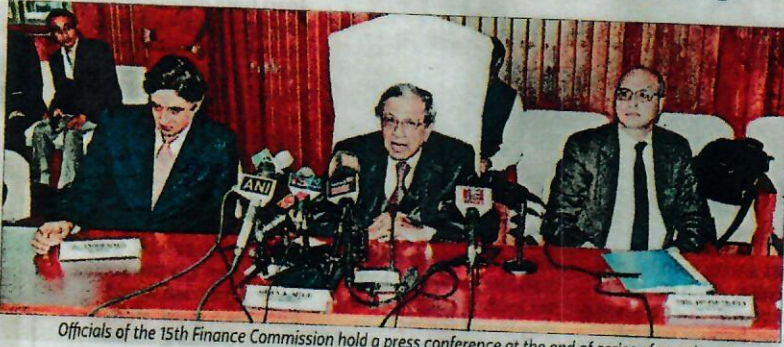
Officials of the 15th Finance Commission hold a press conference at the end of series of meetings